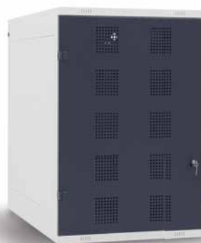
TRITON Golf – Oberschrank Maße H x B x T (mm): 1250 x 825 x 550 RAL Farbpalette: RAL 7035, RAL 9005, RAL 5005