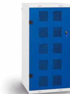
TRITON Golf – Unterschrank Maße H x B x T (mm): 1250 x 550 x 550 RAL Farbpalette: RAL 7035, RAL 9005, RAL 5005