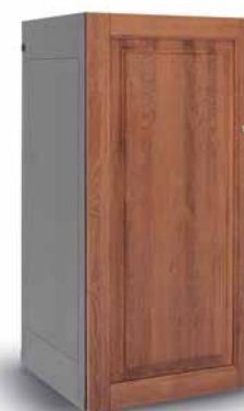
TRITON Golf – Premiumschrank Golfschrank mit massiver Holz- tür Maße H x B x T (mm): 1250 x 550 x 550 1250 x 825 x 550 1250 x 825 x 1100 RAL Farbpalette: RAL 7035, RAL 9005