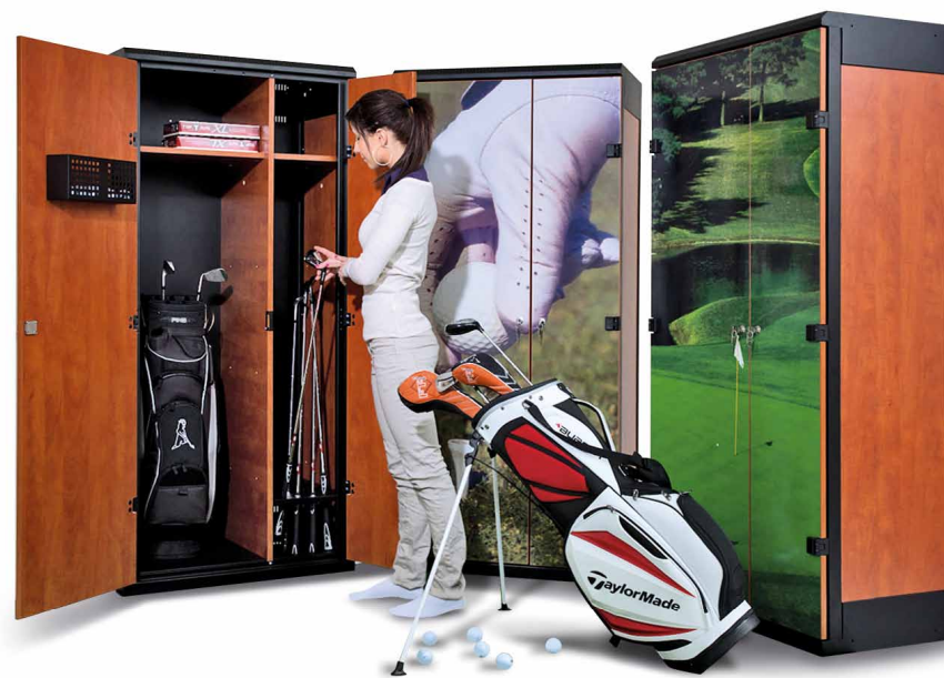
TRITON Golf – Kombination Metall / laminiertes Pressspan, auf Wunsch mit Aufdruck.