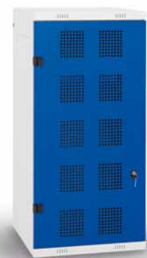
TRITON Golf – Oberschrank Maße H x B x T (mm): 1250 x 550 x 550 RAL Farbpalette: RAL 7035, RAL 9005, RAL 5005