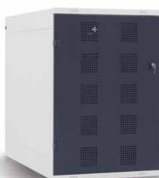
TRITON Golf – Caddyschrank Maße H x B x T (mm): 1250 x 825 x 1100 RAL Farbpalette: RAL 7035, RAL 9005, RAL 5005