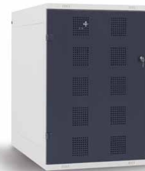
TRITON Golf – Unterschrank Maße H x B x T (mm): 1250 x 825 x 550 RAL Farbpalette: RAL 7035, RAL 9005, RAL 5005