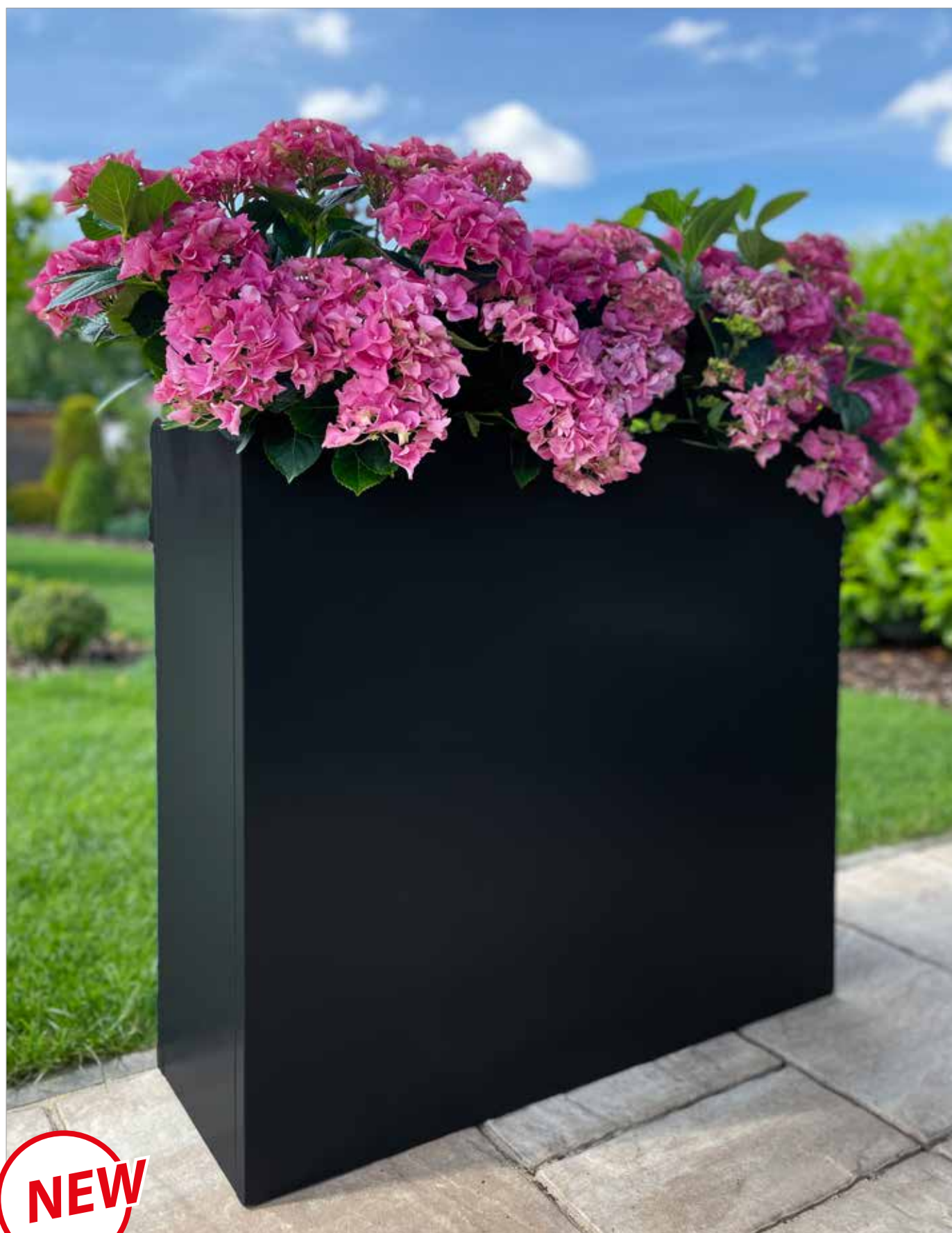
Designový samozavlažovací květináč Tritón