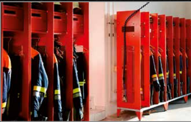
Freiwillige Feuerwehr Erpfting