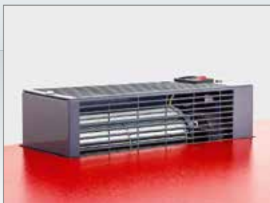
▲ Trockner (Leistungsaufnahme 500 W/Stunde)

Chromkleiderstange mit Haken, Helmhalter innen, Gürtelhaken, verschließbare Boxen, Trockner (Leistungsaufnahme 500 W/ Stunde)