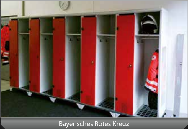
Bayerisches Rotes Kreuz