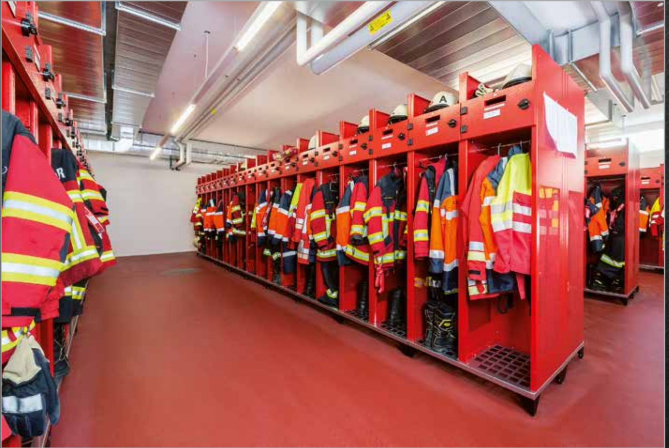
Feuerwehr Buochs Ennetbürgen