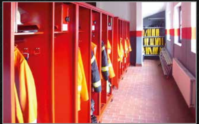
Freiwillige Feuerwehr Munchehof