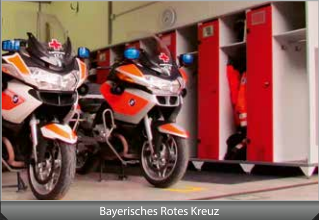
Bayerisches Rotes Kreuz